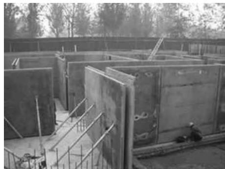
图2 装配式混凝土预制构件实景图展示

混凝土结构施工的要点就在于混凝土结构施工,在实施装配式建筑混凝土结构施工时,技术人员需要把握混凝土调配施工的重点,避免产生结构质量不佳等问题。在利用有关的施工技术时,施工人员及管理人员都需要做好混凝土结构质量的检查工作,一旦混凝土结构质量不符合施工要求,则对于整体建设施工会产生较大的影响,甚至会影响装配式建筑结构的稳定性。在实施混凝土调配施工技术之前,施工人员要严格检查混凝土材料质量,明确原材料的类型及用量。之后再开展混凝土配合比的调配、拌合等工作,对混凝土混合物开展试验检测工作,同时测试其塌落度。不同的混凝土部位需要满足不同的质量要求,技术人员在施工之前需要与工程设计人员进行沟通交流,调配出符合使用要求的混凝土,并且明确用量。需要注意的是,在调配混凝土时需要严格控制用量,避免用量过多浪费施工材料,增加工程施工成本。图2为装配式混凝土预制构件实景图展示,技术人员在调配混凝土时,可以参考其他工程项目的预制构件展示进行调整。