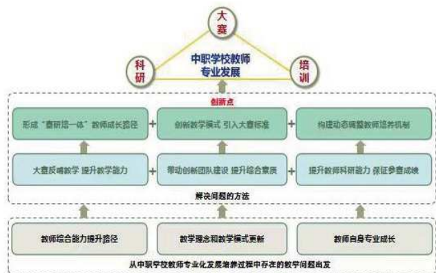
图3- 中职学校教师专业发展解决的教學問題及方法

本课题主要通过文献法、行动法分析技能大赛对教学的方向引领,制定与全国职业院校技能大赛项目对接的课程标准,编制配套的校本教材,改建相关实训基地,进行有针对性的项目教学。这样不仅能够提升课题组成员的科研能力、教学能力、专业能力,同时通过课题研究能够让每一位参与的教师进入到课程改革中,提高教师的专业实践能力和自身素质,促进整个教学团队的健康发展,从而促进整个学校的平稳前进和向好发展。