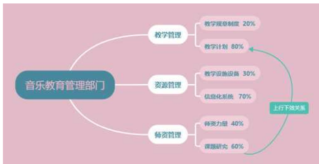
图1 非艺术院校的音乐教育管理部门

就目前而言, 各高等院校的教学管理机构一般包括校、系院两级校级教学管理职能机构要充分发挥教务处、团委、学生处等部门在学校教学管理系统中的职能和作用, 明确各级管理人员各自的职责与工作任务, 努力协调好各种工作关系。系院级教学管理机构由系主任院长全面负责系教学管理和教学研究等工作, 分管教学的系副主任副院长主持日常工作。普通高校是偏宏观管理的, 它的两级管理系统与二级院系体系相对应, 人员与机构的配备较为健全, 规章制度划分管理很详尽, 有着更高的兼容性。例如有些大学, 整个学校有一个负责公共管理的教务处, 总体负责学校各个学院的教学管理、资源管理、师资管理等事项等宏观的行政教务管理工作。各学院另设置学院办公室, 具体到各个学院办公室的职能, 例如艺术与传媒学院办公室等于高校二级院系教务处, 不负责宏观的教学管理规划、大的教学规章制度的制定, 但是在教学过程的具体实践中, 院办公室全面承担着学生管理、学生考勤管理、教学档案管理、成绩管理、教师工作任务管理、教材管理、专业课必修课的考试与评价等日常教学管理的大部分内容, 其职能相当于专业艺术院校的教务处。音乐系的学生与教务处没有直接的工作学习性联系, 学生需要办理的常规事物, 例如查询成绩、查询课表等工作, 均可以不用通过教务处, 而在院办公室就可以完成。同时, 在学院下属各系中又设有教研室, 负责专业范围内的学科建设及教学工作。这样构成了一个由校教务处—学院办公室—系教研室组成的三级教学管理机构。