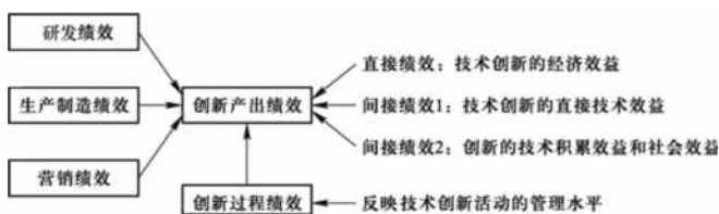
图2 创新产出绩效分析图