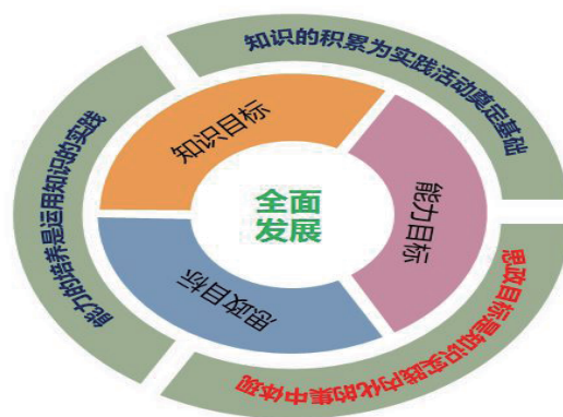
图 2 课程三维目标

三维目标的有机融合是体现“金课”建设高阶性标准的重要内容, 也是“金课”建设教学改革的基础。高等职业教育的基本特点是实践性, 因而课程教学中不能只注重知识的传授, 更应注重知识、能力与素质培养的相统一。结合职业教育基本培养目标——培养生产、服务技术和管理第一线工作的技术性、技能型、技艺型和操作性型人才, 在教学中必须贯彻能力本位, 培养学生的专业技能、职业技能和综合素质。同时要落实立德树人根本任务, 通过三维目标的统一、有机融合实现从“教书”到“育人”, 从而最终并真正在教学中将“立德树人”具体化、目标化。