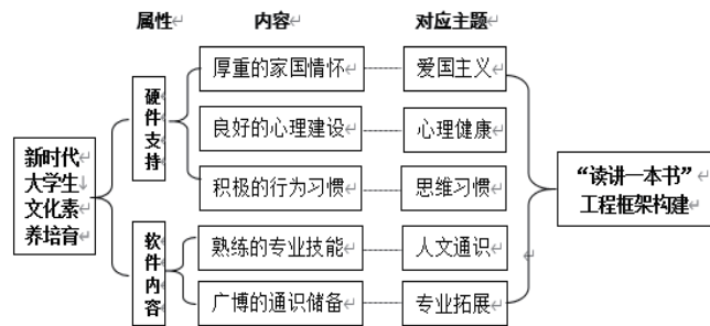
图1：新时代大学生文化素养培育的内涵及对应阅读主题

“读讲一本书”工程必须始终坚持“新时代大学生文化素养培育”这“一个中心”。新时代大学生文化素养培育应由五部分组成：厚重的家国情怀、良好的心理建设、积极的行为习惯、熟练的专业技能和广博的知识储备。这五个部分可归纳为两大类：一类为硬件支持，一类为的软件内容。