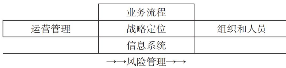
图1 财务共享中心建设路径图

财务共享中心的建设会面临诸多困难,管理人员需要综合市场内外的各种因素来进行综合的考虑。在建设财务共享中心过程中需要借助“1+4+1”的模式,首个1指的是战略定位,起统领意义;4主要包括业务流程以及运营管理等,该部分是建设的具体。最后一个1指的是风险管理,其体现在财务