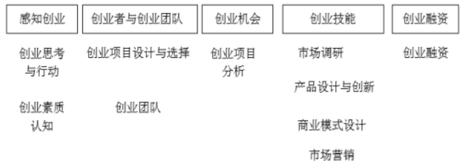
图5-1 创业能力培养内容与方式

践过程中,要求大学生进行市场调研,进行市场可行性分析,注重产品设计与创新,设计商业模式,创新市场营销,能够整合资源进行创业融资 [9] 。大学生创业能力培养内容与方式 [8] ,具体见图5-1: