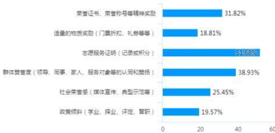
图3 志愿服务激励情况

六是逐渐强化的志愿服务激励机制是对志愿者积极参与社会治理的有效回应，为培育浓厚的志愿服务氛围注入了“强心剂”。在6000余名受调查志愿者中，回答“志愿服务活动结束后，您获得过什么激励”的问题中（图3），获得志愿服务证明的占比最高为51.68%。奉献无价，我们在提倡给与志愿者精神激励为主的时候，可以适当的加强激励，通过涵盖物质奖励、精神激励、荣誉激励、政策倾斜、回报激励等举措，表达对志愿者、志愿服务组织付出的认可和尊重，让奉献爱心、帮助他人的志愿者感受到来自政府与社会的肯定与支持，从而更加愿意做好人、做好事，努力营造全社会支持志愿服务发展的良好氛围。