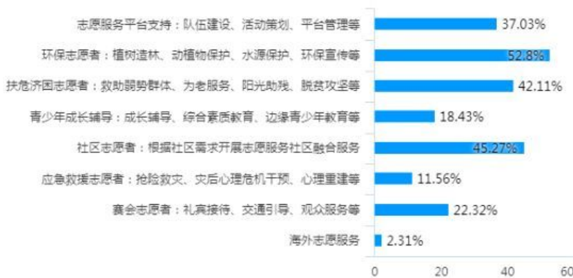
图1 志愿服务参与领域和意向情况

一是组织规模不断扩大,志愿者和志愿者组织的数量、从事服务的时间、服务领域的深度和广度等更加多元化。淄博市志愿服务发端于1994年,同年8月,淄博市青年志愿者协会在民政局登记注册。截止2020年12月,淄博市注册志愿者数量72万余人,比去年同比增长12.7%,登记志愿服务活动项目20000余项,志愿服务时长300万余小时。其中,注册志愿者数量占淄博常住人口的15.3%,换句话说,每6个淄博人中就有1名志愿者。因志愿服务需求的多样化、广泛化,受调查志愿者服务领域参与和意愿方面(见图1)呈现多元化。