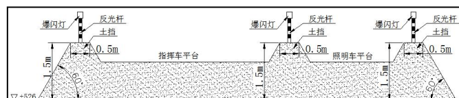
照明车、指挥车平台典型横断面示意图

排土工作面设置照明车、指挥车平台(周围土挡顶宽 0.5m, 高度 1.5m, 坡度为 60°; 平台高度 1m, 长、宽根据需要自行确定), 平台采用砂石料修建。四周布设反光锥, 顶面四个角布设反光杆, 平台距离排土线不小于 50m。