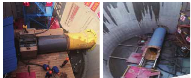
顶管机机头及正常管节顶进工作图

泥水平衡顶管掘进机采用计算机闭环控制的泥水平衡机理, 全部操作在地面控制台控制。顶进千斤顶, 观察工作仓的泥水压力表, 控制顶进速度, 出土量保证舱内、舱外压力平衡。由于过慈江顶管顶部包含河底淤泥层在内约4.2m, 覆土层厚度较薄。为防止在顶管穿越慈江时触变泥浆从江底冒浆或发生顶管机头上浮等情况, 在顶管机尾端增加一套二次纠偏设备, 能更好的做好顶管顶进过程中轴线精度控制。顶管穿越慈江堤岸即将经过江底时, 应降低顶管顶进速度、随时观察机身姿态变化、控制轴线偏移情况。顶进过程中安排专人对堤防和石油管线进行安全监测, 观察河面机头位置出现冒气泡、进出泥触变泥浆管流量的变化情况。