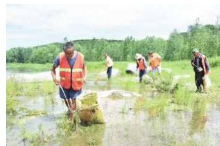
图3 水域打捞活动现场

到河长制的管理中来,这样可以第一时间将河流治理的情况上报至当地政府部门,然后将河长制工作落实到乡、村。此外,还应该建立县、乡镇水利管理部门、村,三级河长体系,在县级领导的领导下,针对河流的实际情况来看来制定相应的管理,建立科学合理的河长制管理体系。让人人都参与到河流的治理当中去,图3,水域打捞活动现场。对于各级负责人管理的职责而言,要让其充分认识到自身的管理职责,如果河流水系管理不力、污染严重等问题频繁,那就要第一时间追究其管理责任。在引导下,发动群众的力量,将河流巡查、河道污染治理、河道健康安全监督等工作顺利地开展工作,然后在建立完善的惩奖机制,有效地将群众治理河流的积极性调动起来确保基层河长制管理顺利开展。