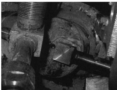
图2 B2 出线套管水接头上的渗漏点(黑圈中)

研究 2019 年 8 月二号机组大修后风压试验,发电机风压试泄漏数据大于标准,检查发现由于发电机中的氢气压力超过冷水的内部压力,氢气进入内部冷水,使得冷水量超过常规,这表明发电机的冷水管线泄漏。为了检查密封性,发电机通过 0.5MPa 定子的完整液压试验进行检验。仔细检查后,确认线点 C2 外壳的外部端口泄漏,但泄漏点位于出口外部,并且未在上方的内部冷却器中产生氢气。将水压增加到 0.6MPa,仔细检查管腔内的 B2 套管手包绝缘处有渗出的水滴,并将去除的绝缘物完全浸入水中(此情况正是 B 相定子绕组直流泄漏电流偏大的原因)。一旦所有背部绝缘层被移除,就会发现沙眼从冷却水的电连接到 B2 外壳侧的焊接泄漏,铜质材料上已有轻微水腐蚀形成的绿铜锈(见图 2)。