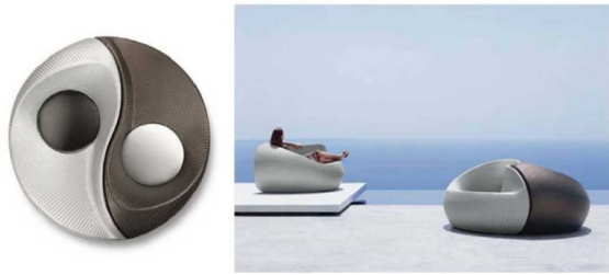
图1 太极沙发