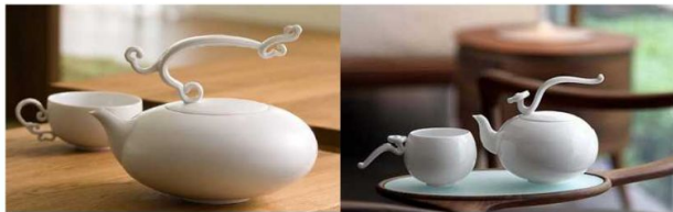
图3 茶壶设计

对于用户为中心的产品设计来说，不同层次的人群，对产品的功能有不同的认知 [6] 。由表及里的功能性语义，表现为产品外在的实用性和易用性，具有简单的形式，这种精简需通过视觉化的形态语言来实现这一目的。因此，形态、肌理、材料、色彩、质感等可以成为功能性语义的传播媒介。由内而外的功能性语义，不仅依据产品的内部结构来确定产品的造型，同时使用者的认知行为和习惯性思维也是重要条件，反映出语义环境和情景。如(图3)中的茶壶设计，把手的设计根据人手抓握的语义特征进行处理，具有操作暗示，把手结合了云纹和如意纹的形态，使其更具有文化底蕴。