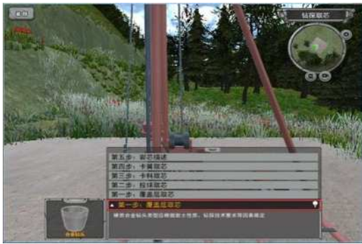
图 1 勘察场景三维仿真

3、漫游功能:实现三维仿真环境模拟实际工程现场，操作者可通过人体输入设备在系统中任意走动体验，全方位的观看。