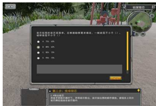
图 3 考核模式

操作过程中会根据知识点随机考核理论知识，系统自动记录作答情况；操作过程中给出多个设备或材料让考核者进行选择，系统自动记录选择情况；考核过程中操作步骤不可进行跳转；钻探取芯模块中，学生需能自己绘画岩芯素描图和手动输入对岩芯的描述，老师可对其进行批阅。