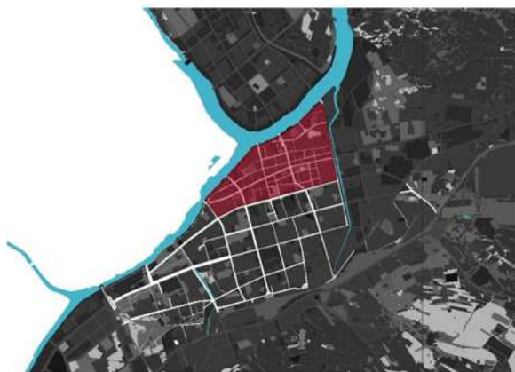
图3 赤峰市“九街三市”片区区位图