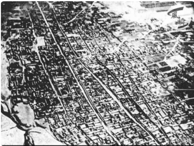
图2 老赤峰俯瞰图从高空俯拍，九街三市历历在目

片区，既解决了日益破败的建筑风貌的问题，又能满足当下商业复兴的需求，成为赤峰历史片区建筑活化利用的一个典范。（图3）