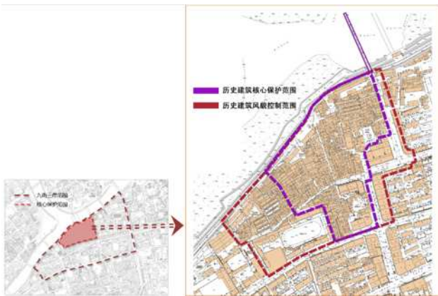
图5 划定历史建筑保护区范围