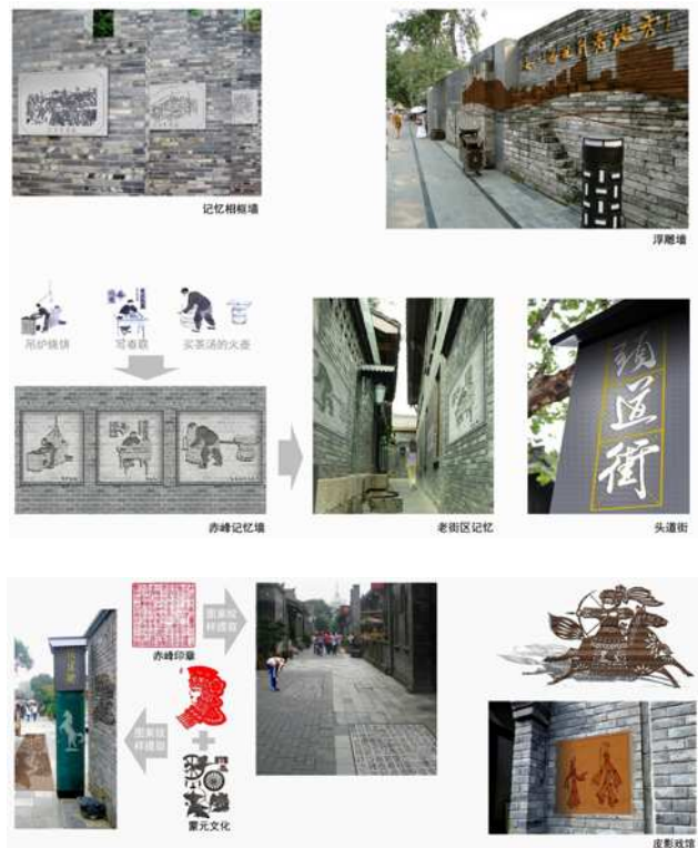
图4 地域文化符号融入建筑

要传承文化，发展有历史记忆、地域特色、民族特色的赤峰，提炼赤峰的文化符号，打造提示城市记忆的景观必不可少。比如最具红山文化特色的玉龙、兴隆洼文化的玉玦、富河文化的花纹等。将凸显沉淀民族特色的地域文化符号融入到建筑修缮设计中，作为建筑语言文化，可以体现城市的差异性，而这个差异性恰好是一个城市的魅力所在。（图4）