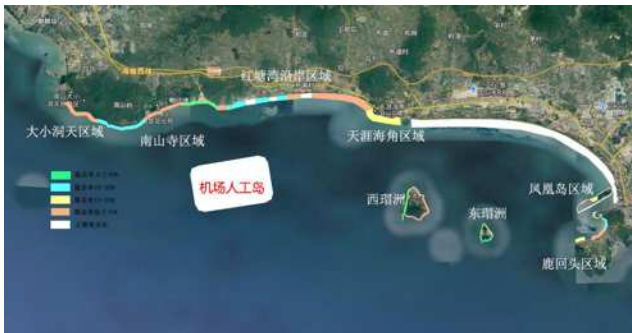
周边海域珊瑚礁分布图

三亚周边海域水质较好,红塘湾近岸海域有较好珊瑚礁生态分布,人工岛填海施工过程悬浮物扩散可能引起水质发生变化,对珊瑚礁生境造成影响,同时人工岛建设导致岸滩局部冲淤也将会危及珊瑚礁部分生长环境。在项目围填海施工过程须采取必要的工程环保措施,控制悬浮物的扩散范围,工程实施后,建议可采用迁地移植及生态护岸等形式重新构建新的生态系统。