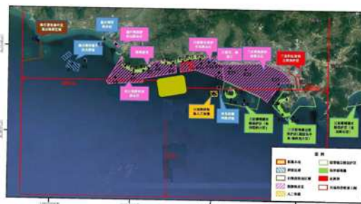
三亚新机场周边敏感目标分布图

本项目填海规模较大, 周边海域海洋生态敏感目标较多, 属于特大型填海工程, 适当扩大环境影响评价范围。东西方向评价边界距离各30公里, 南侧向海延伸20公里, 北侧至岸边。东侧是天涯海角景区, 西侧是南山观音旅游区, 岸边有珊瑚礁资源分布、西侧海域有中华白海豚活动等。