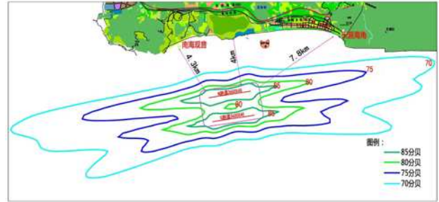
机场噪音分贝模拟范围示意图

机场噪声影响是城市重点关注的污染源,项目选址位置相对避开飞机起降噪声对周边的影响,其噪声影响主要沿跑道方向向两边延伸,主要影响区域在海上,对陆上的南山文化景区、天涯海角景区、居民生活等造成的影响是相对有限。