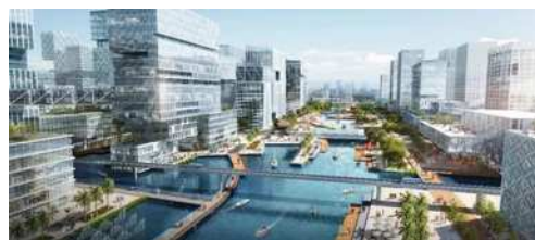
图2 城市三维景观图

这两者之间的关系是彼此独立的。城市规划主要是为城市活动提供充足的空间或者是结构,在进行规划和设计的环节中,会包含有园林景观、特点性质、公司产业、社会人文等各种各样的因素,是一种系统化较高的课程。借助对城市空间做好合理的分析与设计,那么在开展实践的环节中,就能够通过先进设计理念的应用来完成各项设计工作,保障所有的要素都可以形成高度的统一 [4] 。建筑设计通常是将城市规划设计当做前提,来推进各项工作开展的,要求相关人员联系整个城市的特点、环境、工程技术、施工目标等等来进行设计(如通过CAD技术或BIM技术创建整个城市的三维景观(如图2)),如此就能够满足建筑物周围或者是其内部空间的大量需求,同时整合其本身的功能,对建筑空间的组合形式、规模、外形等进行设计,再融入一定的创新元素,让其可以和当地的地形地势、环境因素、文化体系彼此适应。