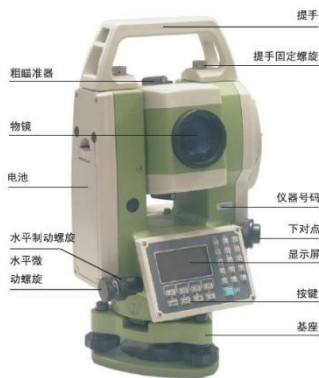
图1 全站仪结构示意图

全站仪是当今水利工程中最流行的一种，它在计量工作中占有重要的位置。当前，我国正处于一个科技进步的新时期，许多水利设施的检测手段已不能适应现代水利建设的需要。在以前的水利工程中，一般都会采用水平仪法、经纬仪等，虽然它们可以准确地反映出工程的质量，但是从现实情况来看，全站仪在目前的水利项目中有着很大的优越性。首先，全站仪的测量范围很大，可以精确的测量，携带起来也很方便，精度也很高。其次，全站仪的综合性很强，并且覆盖的范围也很广，可以说，全站仪不仅可以保证工程的精度，还可以推动我国的水利事业的发展。很明显，这与我国过去在水利建设中所采用的计量器具有很大的优势。但是，在实际应用中，也有一些值得注意的问题，即在实际应用中，全站仪的测量精度和误差都有很大的缺陷。比如，测量的坐标，垂直角度，都要准确的定位，这样的话，就可以降低整个仪器的精度。可见其在水利方面的重要性。