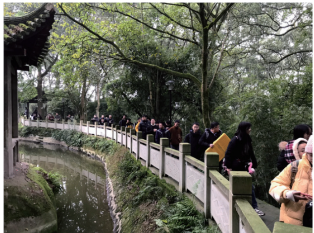
图3 教师团队带领学生实地踏勘聚奎书院