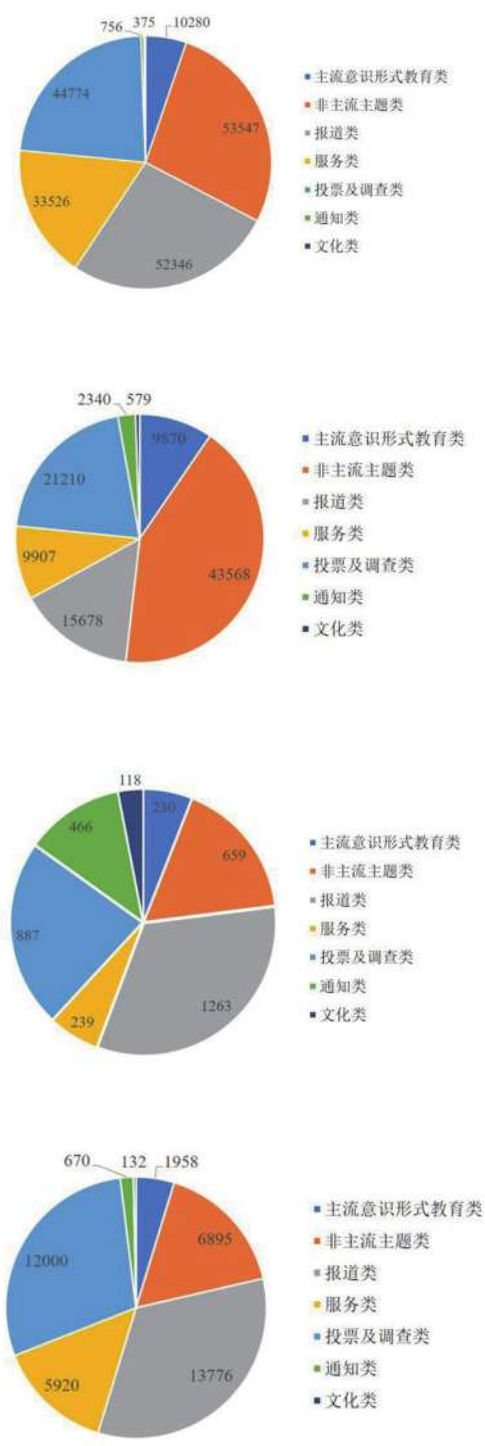
图6 旅健新青年不同类型推文阅读量情况