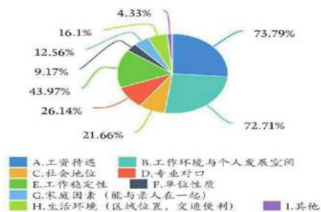
图3 大学生择业时最看重的因素

注:本图为问题“您在择业时最看重哪些因素:”调查数据