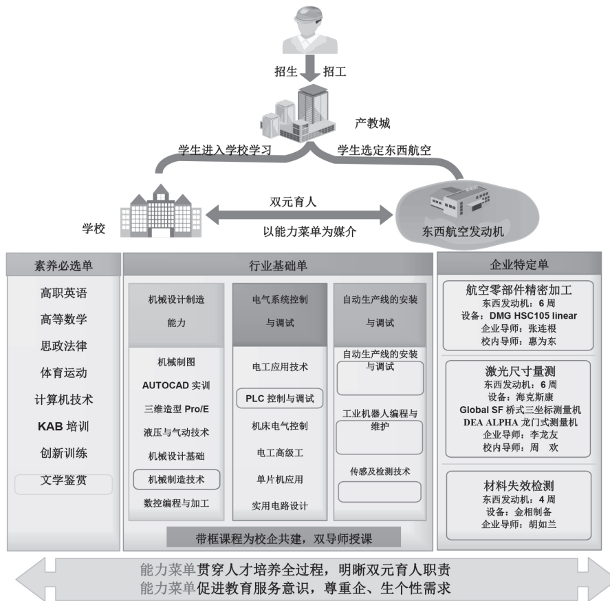
图 2 东西航空发动机能力菜单架构示意图

隐形作用充分发挥出来，专业课程教师授课过程中，应巧妙地将人文精神渗透至教学进程中，协助大学生学习、掌握专业理论知识与技术能力的同时，也接受到人文素质教育，取得“润物细无声”的素养教育效果。