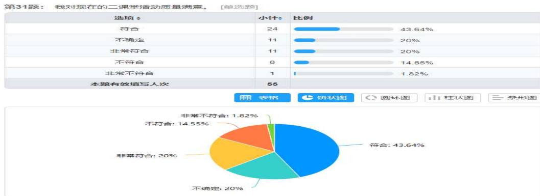
图 1 学生对活动质量的满意程度

操作中, 需适当减少课时。表中其他活动设置较为均衡。同时, 多媒体、自媒体融入第二课堂活动后, 学生课堂表现过于活跃, 这也影响到学生学习知识的效果。