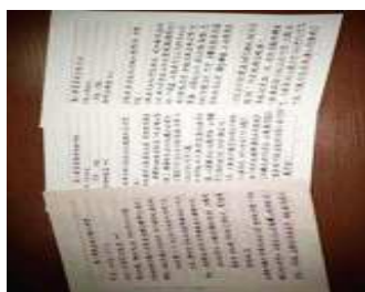
图2 19春季学期—19秋季学期访谈调查

但从数据上(表4)分析看出,仍然有学生没有达标。通过投影改进分析得出,学生DMU21由于活动课堂表现过于活跃,影响了英语学习效果。DMU1该生成绩在下一年度活动中提高27%,才可达成预定教学目标。