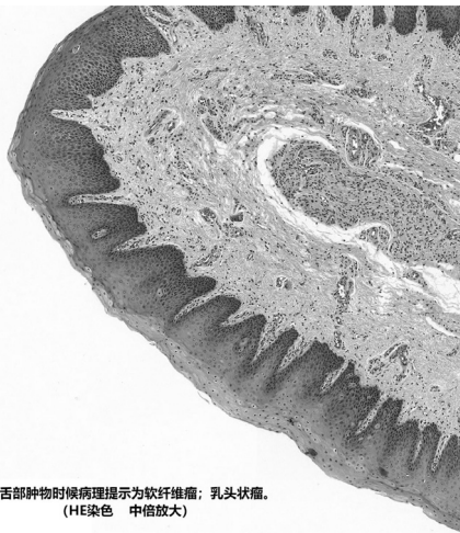
图2 舌部肿物时候病理提示为软纤维瘤;乳头状瘤。(HE染色 中倍放大)

质,改善患儿面部畸形。围术期无意外及并发症,术后患儿唇、舌形态及功能恢复良好。术后舌肿物病理结果为(舌肿物)软纤维瘤;乳头状瘤。(图 2)