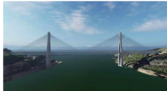
图2 桥梁精细化管理养护