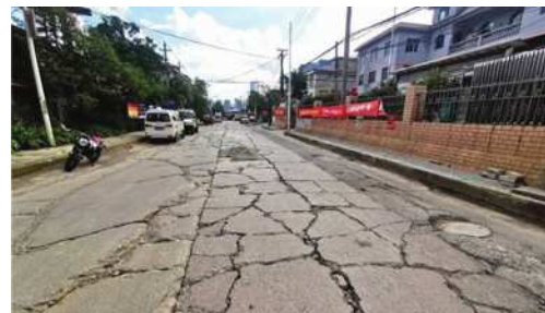
图2 公路路面网格状裂缝

网格状裂缝可以被视为纵向裂缝与横向裂缝的结合体,总的来看,此类裂缝最初多数表现为相互交叉的纵向裂缝,随着车辆的不断碾压,裂缝可呈现网格交叉状特征不断拓展,从而形成网格状裂缝。