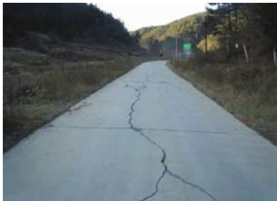
图1 公路路面纵向裂缝

纵向裂缝多数出现在公路边缘位置,其与公路的延伸方向具有较强的同一性。总的来看,此类裂缝往往会导致公路路基受到影响,继而对公路工程整体质量造成破坏。相关研究资料显示,若不能及时对纵向裂缝进行合理修缮,则其有可能导致公路路面出现沉降问题,继而对来往车辆的安全造成威胁 [1] 。