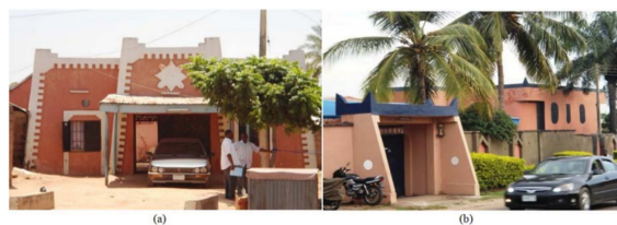
图 4. 显示豪萨复兴建筑来源: [1] 。

需要准确使用复兴建筑,以便新旧设计之间存在传统关系。图 3b 中的设计是位于卡杜纳州的一栋住宅楼,也是尼日利亚北部的一个主要豪萨社区。该建筑既不是对传统的创造性社会延伸,也不是对其在意义体系中的位置的符号平衡的明确表达 [14] 。设计中使用的各种代码似乎适合审美复兴。建筑的特点,如入口门廊上的圆顶和护墙上的尖尖塔(赞克瓦耶),这意味着真正的豪萨建筑在语言和规模上都符合其背景。该设计不仅回归了传统时尚,而且采用了区域社会平衡的方式。因此,合理的建筑必须具有象征性的参考,图 3 中的当代设计在其外观上更多地是传统设计,对传统梁(Azara)、拱门、护墙和整个组成特征的模仿在其建筑建议中纯粹是豪萨风格。这些难以定义的建筑元素令人信服地采用了历史来源,这也代表了新旧豪萨设计系统之间的象征性联系。