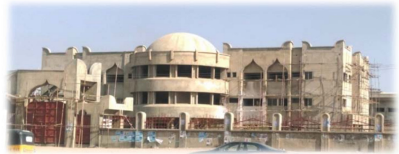
图 7. 显示豪萨复兴建筑来源: 作者。

豪萨社区的建筑模型是某些传统态度的表现,也是长期传承文化的表现。组成部分的组织通常符合经济因素,并响应社会文化价值。上图中的住宅建筑以源自特定文化的特定身份而独具特色。设计所附带的文化象征定义了豪萨人的价值体系和信仰。它不仅包括豪萨人的智力艺术,还包括共同的社会文化信仰,即房子应该有一个带女儿墙(拉瓦尼)和尖塔(赞克瓦耶)的平顶。它们是从具有文化特色的豪萨传统家庭建筑复制而来的杰出建筑模型。整个复杂而独特的模型展示了文化符号、进步信仰和文化认同。