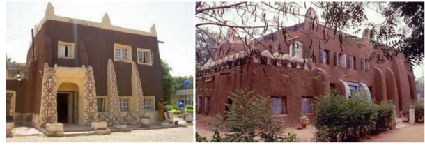
图 1. 显示豪萨传统建筑。

关于北方社区的定居点和传统习俗, 豪萨建筑是在当地可用建筑材料的范围内组织和装饰的, 也反映了前一个时代的创造性工作和宗教姿态 [1, 3] 。豪萨传统建筑以其富有创造力的作品而闻名, 其外观真诚, 具有独特的组成特点。阿利尤 [1] 表示, 豪萨传统建筑应该被视为对离开该地区的人们的文化价值和传统方式的诠释和表达。他进一步指出, 传统的方法和象征性的构建元素 (图 1) 是文化思想, 或者“甚至是通过从特定的例子中概括而形成的思想, 这些思想也以态度、信念、原则和习惯的形式从过去推动并帮助塑造上下文” [1] 。随后, 建筑的建筑特征和一般物理外观直接表达了他们的起源 [8] 。