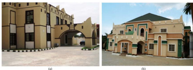
图 3. 显示豪萨复兴建筑来源: [1] 。

和公认的实践而建立。由于最初的阶级和通常的一般特征,态度产生了差异 [14, 9] 。然而,正如在尼日利亚北部的豪萨社区所称,“建筑复兴风格”通常意味着有意识地展示历史建筑元素的当代设计,以及对旧设计人物的一些姿态 [13, 14] 。因此,该方法是当前纪念设计概念回归的知识来源之一,对于在建筑形式和结构上创造连续性的公共建筑和住宅建筑,以及对先前存在的感知设计的回忆都很重要 [1] 。