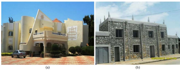
图 6. 显示豪萨复兴建筑。

物质文化和传统身份。随后,豪萨的建筑身份在当代设计中以许多不同的方式被确认。复兴派设计中最重要元素是通过护墙(拉瓦尼)和尖塔(赞克瓦耶)来传达豪萨人的身份,有时还使用了俗称北方结“阿雷瓦符号”或“达金阿雷瓦”的文化符号(图5)。这种方法在图4a和6a中很明显。图4a中的设计位于吉梅塔·阿达马瓦州,设计师清楚地理解,建筑不仅仅是一种“让人愉悦的商品”,它最能反映当地的文化环境,其独特之处在于风景如画。设计师很快使用了北方结(Arewa符号)来表示建筑的身份。该设计“代表了一个活的标志性景观,具有共同的文化身份和地方感,是社区长期积累的努力产生的” [17] 。因此,设计词汇提供了一个关于地域文化的评论,一目了然。