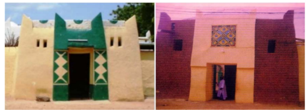
图 2. 展示了豪萨传统的立面装饰, 表面刻有尖塔 (赞克瓦耶)。来源 [12] 。

传统建筑一直是豪萨社区不可分割的一部分, 并以描绘豪萨文化设计的不同类型的建筑作为象征 [3] 。因此, 住宅和非住宅建筑都具有传统和文化表现形式的特点, 如带肋拱顶的住宅平屋顶 (Bakan gizo)。平面图中通常为矩形或圆形, 泥砖墙也布置在围墙庭院内 [6] 。墙壁上还装饰有尖尖的尖塔 (Rawani), 饰有护墙 [7] 。外墙表面 (图 1 和图 2) 有时装饰有文化几何图案 (Makuba plater), 也装饰有代表其起源的豪萨创意艺术图案和符号 [19] 。内部空间“以拱顶和桥墩装饰为特色, 墙壁、狭缝、穿孔、拱门和图案的大小和比例各不相同, 以吸引观看者, 并使其对室内单元的卓越品质印象深刻” [12] 。这套集体原则是一种明确的表达态度, 它实际上重视在气候、社会经济和地方方式中传承下来的文化和传统, 以传达社会系统 [22, 2] 。