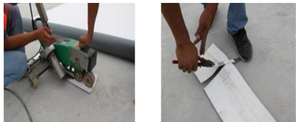
图 2 PVC 热熔封边试焊检测

施工人员要注重卷材铺贴对于屋面防水作用体现的重要性，铺贴时一定要注意顺水搭接，且搭接的宽度一定要大于 10cm；之后再向屋脊移动。在完成铺贴施工之后，要使用专的压辊进行压实提高层与层之间的紧密性。在完成卷材的铺贴施工之后，技术人员需要使用热风焊机进行搭接边的热熔封边工作，以保证将防水卷材连接成一个密封的整体。在热熔封边工作实施前需要进行设备调试，即“试焊”（图 2 为 PVC 热熔封边试焊检测）。当试焊的强度达到要求时才能进行搭接缝的封边工作，检测条的断裂点应在热风焊缝的内侧。