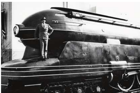
图2 雷蒙德·罗维设计的S1型机车

雷蒙德·罗维是美国工业设计的重要奠基人,其设计项目大到飞机、轮船、火车、汽车、宇宙飞船和空间站,小到邮票、口红、标志和可乐瓶子,成功案例无数(如图2)。目前,国内外学者对他的研究主要集中在以下四个方面:设计实践研究、设计思想研究、书籍著作研究和企业管理研究。多数学者主要从罗维设计实践方面着手,剖析出了罗维设计公司的发展。对罗维设计公