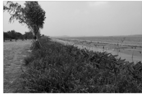
图 3-4 湖滨部分挺水及湿生景观效果

湖滨带主要包括挺水及湿生植物的种植(如图 3-4),主要品种有芦苇、芦竹、再力花、海寿花、鸢尾等,种植面积约 279227.4 平方米。主要靠根系吸收淤泥中的营养物质,释放氧气,净化空气。