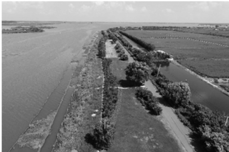
图 3-2 白马湖湖岸岛瞰景观二

其中陆域主要品种有香樟、水杉、金丝垂柳、银杏等(如图 3-3),总面积约 679480 平方米。具有保土固堤、截流、过滤地表污水、美化水岸的功能。