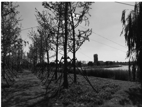
图 3-3 湖滨部分陆域景观效果

其中陆域主要品种有香樟、水杉、金丝垂柳、银杏等(如图 3-3),总面积约 679480 平方米。具有保土固堤、截流、过滤地表污水、美化水岸的功能。