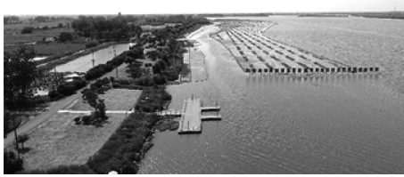
图 3-1 白马湖湖岸岛瞰景观一