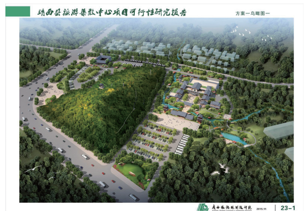
图 2 鸟瞰图

为了突出“边境古院,靖西之合”的主题形象,达到展示靖西“核心”的文化灵魂,传承靖西“合和”的文化源流这一规划目标,规划做了几个方面的努力: