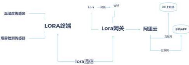
图 3.1 总计结构设计

总体设计：如图3.1所示基于LoRa技术的室内环境监测及智能调节系统，能即时收集室内，温湿度数据，空气质量数据等，将采集的数据处理后的计算结果作为智能调节模块的控制依据，空气质量监测指标包括温湿度、CO浓度等一系列数据。相对而言，室内空气监测节点根据安装位置的空气流通情况，只能采集局部的空气质量数据，因此需要部署多个监测节点计算加权平均数据作为空气净化模块的指标输入。整个系统由节点与监控中心两部分构成，设计了一个分布式采集和管理，当采集到的数据超过设定好的阈值时，会反馈回云平台，手机app和PC端都会收到相应的提示信息。