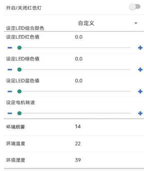
图 3.6 移动端数据采集设置情况