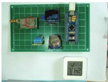
图 3.4 运行情况

通电后进行测试，当运行稳定时，传感器采集数据通过 Lora 传输给网关，网关将 Lora 转换为 Wifi 发送给机智云平台，手机或者电脑可以通过查看机智云平台实时查看系统的运行状况，若测出的温湿度以及一氧化碳浓度在阈值范围内，则正常显示，若超过设置阈值，则发出警报，得到的测试结果如图所示。