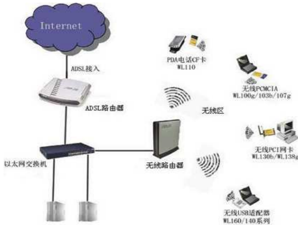
图 2.1 Wifi 网络架构示意图

如图2.1所示WiFi模块一般采用指定信道号的方法来实现快速组网。在一般的无线联网过程流程中，会先对当前的所有信道自动完成一个扫描检查，并寻找要接入的目的AP创建的网络。串口wifi模块中给出了设置工作信道的参数，在可知目的网络系统所在信道的条件下，可以直接指定模块的工作信道，以便于实现提高连接速率的目的。