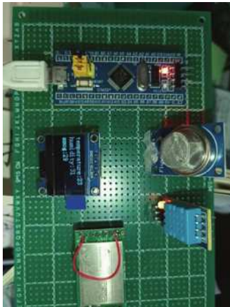
图 3.3 实物连接

通电后进行测试，当运行稳定时，传感器采集数据通过 Lora 传输给网关，网关将 Lora 转换为 Wifi 发送给机智云平台，手机或者电脑可以通过查看机智云平台实时查看系统的运行状况，若测出的温湿度以及一氧化碳浓度在阈值范围内，则正常显示，若超过设置阈值，则发出警报，得到的测试结果如图所示。