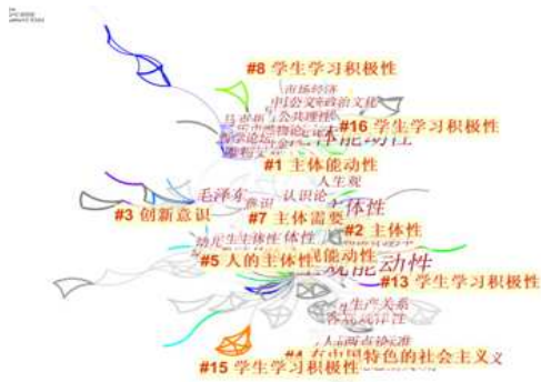
图1 基于CNKI的关键词聚类分析图谱

从图1这张关键词共现关系知识聚类图谱图可以看出，该研究领域关键词最主要的是主观能动性，其次是主体能动性，然后是主体性。通过对关键词图谱中的重要节点所对应的相关文献进行统计和梳理，发现当前学者们围绕学生学习积极性问题开展了大量的研究。且统计后发现：能动性的研究大致分为三个阶段。第一个阶段是研究的基础是人生观、意识能动性、主观能动性等这样的意识形态领域；第二阶段的研究逐渐延伸到生产方式、生产关系上，这也与当时时代息息相关；第三阶段为目前的前沿热点大学生，侧面反映出我国当前对大学生这类群体主观能动性的重视。