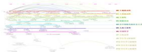
图3 基于CNKI的知识聚类和时间线分析图

从图3基于CNKI的知识聚类和时间线分析图中可以看出：研究的前沿热点主要是区域经济、企业能力系