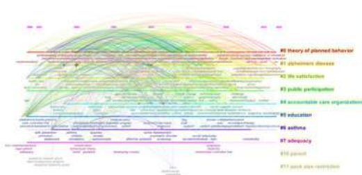
图 4 基于 WOS 的知识聚类时间线分析图谱

统、个性化以及价值共创。因此国内未来的主观能动性研究方向就可以多从以上所述方面进行研究，为未来个人、企业乃至社会的发展提供更多的知识性支持。