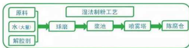
图3 湿法磨矿流程图