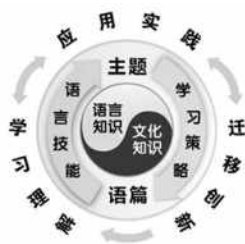
图 1 英语课程内容表（中华人民共和国教育部，2022 年）

《义务教育国家英语课程标准 2022 版》规定，英语课程内容由主题、话语、语言知识、文化知识、语言技能、学习策略等要素组成。围绕这些要素，学生应通过学习和理解、应用和创新等活动，在义务教育的整个过程中发展其核心素养。