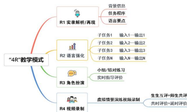
图2 教学策略设计：“4R”教学模式

ence)、语言强化 (Language Reinforcement)、角色扮演 (Role-play) 和视频录制 (Video Recording) 4 个核心教学环节，以实战化口语任务为切入点，融合多种教学资源、手段和方法，激发学习兴趣。(见图2)