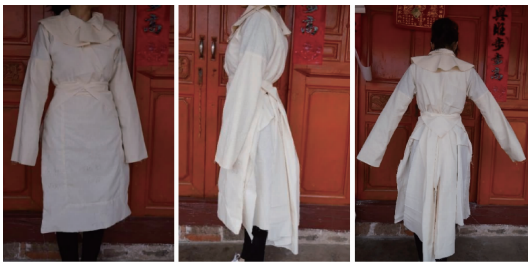
图 3 样衣结构临摹

长方形裁片, 四边拼接贴布绣的条形裁片, 长约 65—70cm, 穿着时底摆的长度大约在膝盖以下的小腿位置。(图 3)。