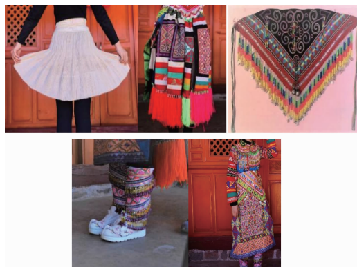
图2 百褶裙、飘带、三角小围腰、绑腿、长围腰