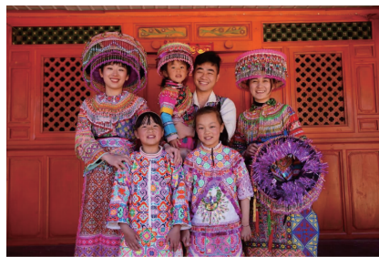
图1 长袖上衣、披肩、包头、围腰、领褂

小围腰:三角形,昌宁苗语称之为“手扶头”,每套盛装中一般有2-4块,最少2块,系法多样。绑腿:宽为10cm,长为4m,以缠绕的形式裹于小腿,绑腿绣上各种精美图案,苗语称为“铕”。长围腰:长方形,从腰部开始下至膝盖,垂直向下(图2)。