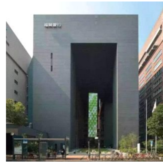
图8： 黑川纪章设计的日本福岡银行总部大楼

(3) “灰空间”。由日本建筑师黑川纪章提出，是指建筑与其外部环境之间的过渡空间，以达到室内外融和的目的，有模糊性和不确定性。他设计的福岡银行总部大楼，利用切削的手法，用日本传统门的意向，创造了一个介于室内与室外空间、公共与私有空间之间的过渡空间 [2] 。