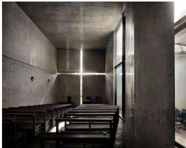
图5： 1989年安藤忠雄设计的光之教堂

(3) 光影。常常通过采光窗口的处理得到。如1989年日本著名建筑师安藤忠雄设计的“光之教堂”。