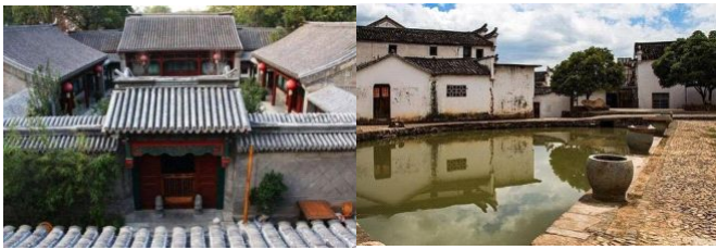
图3、图4： 北京四合院和江浙建筑

(1) 地域性特征。可以从东西方根本性的差异看出，如西方以石为基本材料，风格坚实、封闭，东方是木构建筑体系，风格轻巧开敞。如北京合院住宅平和协调、尺度可亲，江浙一带则宅墙高筑、粉黛瓦墙、一派清秀。