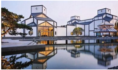
图2： 贝聿铭设计的苏州博物馆

说：艺术不是靠理论说明，而是靠范本发挥作用。如贝聿铭的苏州博物馆，白墙青瓦、古朴雅致的水墨画的意境美，人们被这寓于其中浓厚的中国传统文化所打动 [1] 。