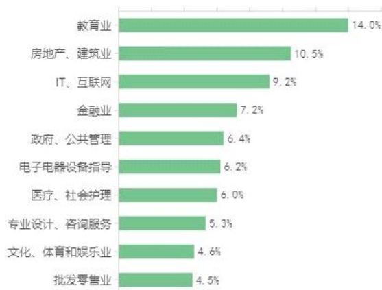
图2 2021届本科毕业生就业去向分布

经济长期转型方向强调多措并举推动制造业,在这个转型过程中,多数大学生第三产业就业方向的选择,导致毕业生专业性与就业市场匹配度不高,并且随着经济结构转型的发展,“教育双减”、“互联网平台反垄断”、“房住不炒”等政策的出台,也给近年来的大学生就业带来冲击。(见图1、2)