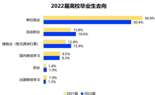
图3 2022届高校毕业生去向统计调查

在就业形势如此严峻的情况下,国家出台了一系列就业优惠政策,如拓宽岗位供给、简化就业手续程序、提升就业服务质量等,而面对如此激烈的竞争环境和就业求职压力,部分毕业生还是选择了暂缓就业。某就业求职网站做过一个高校毕业生去向调查统计,调查结果显示2022年单位就业毕业生人数占比50.4%,较2021年下降6个百分点,而慢就业人数较去年增长了3个百分点,毕业生慢就业情绪蔓延。慢就业的原因有不知道自己究竟适合什么样的工作、没有提前做好职业规划、想加把劲儿弥补短板、参加社会活动、“先喘口气”、沉淀自己、选择继续深造、计划创业、自媒体、适应角色转变、新业态等等。从表面上看,“慢就业”似乎是社会环境变化以及家庭经济好转的表现,但也反映出如今大学生就业指导的不足与职业生涯教育的缺失。