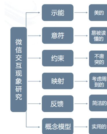
图1 分析微信交互现象步骤图

巨头,已深深融入人们的学习和生活,其交互设计也是别有特色,成为了微信的核心竞争力。本文通过交互设计基本原则中的设计心理学,研究微信交互现象,探索微信是如何将设计心理学融洽的运用到交互设计之中。微信交互现象分析步骤图如图1所示。