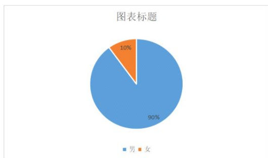
图3-2 足球教练性别分布(N=28)

通过调查问卷统计的数据发现,男教练占到90%,女教练仅有10%,男女教练比例严重失衡,对校园足球的开展和可持续发展存在着较大影响。