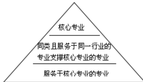
图2 商科专业共同体构成

商科专业共同体,是指为促进新商科的发展,应以核心专业为主,同类支撑核心专业的专业为支柱,以及其他服务于核心专业的专业为辅构建的人才培养模式。