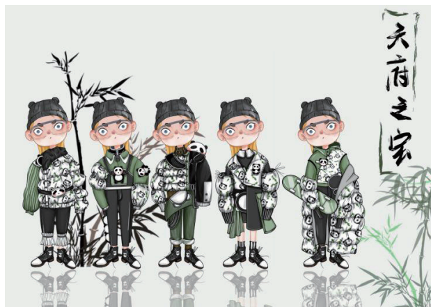
图 3 具有地域特色的旅游休闲服装设计 (学生作品)

根据以上的教学改革实施, 开展了“旅游服装与服饰设计”课程, 通过学生的教学成果展示, 进一步说明了本课程的教学改革的思路的可行性。由于前期做了很多的课程准备工作, 学生在完成实训环节也更积极, (如图 3) 具有地域特色的旅游休闲服装设计, 主要以四川熊猫为灵感, 进行童装设计, 该系列设计参与了大创与校企合作项目, 不仅荣获了省级二等奖, 而且参与了校企合作的项目, 投入了生产、进行了试销, 使学生专业知识和企业的实训技能得到了全面的提高。