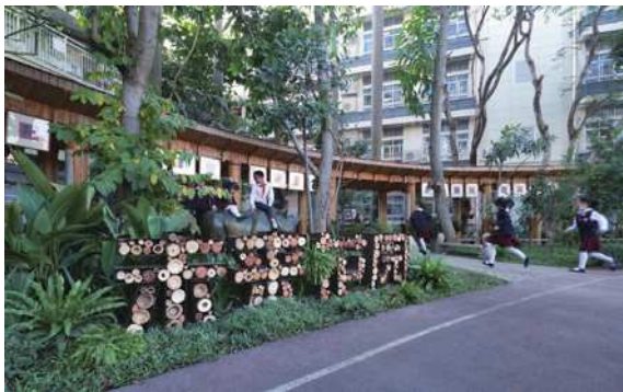
图2 深圳前海小学未来花园景观设计

面对不同的古村落情况和条件,应该有不同的考虑和设计,因地制宜才能更好的适应不同的场景和需要。影响古村落形成的条件有很多,包括历史文化,地理环境,气候和自然植物,天气等等,我们在进行改造设计时应该实事求是,充分考虑当地的各种条件,不能盲目的套用和抄袭已有的设计形式。如植物可以选择有特色的且适宜当地生态环境的本土植物,而不是盲目追求“流行”,根据地形来合理规划功能区和空间,而不是一味追求形式,大兴土木。