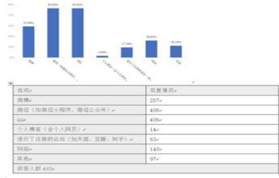
Q1 您经常从哪些新媒体平台中了解有关民族团结的信息: (可多选)