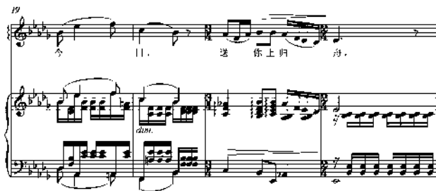
图2 江定仙《岁月悠悠》谱例

最后的尾声是由53-55小节组成的，依旧使用了基本段的音乐材料，与前奏相互呼应，让听众觉得意犹未尽，对歌曲留下极深的印象。