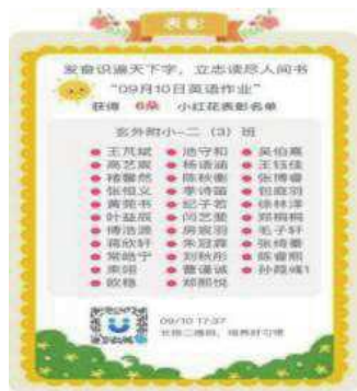
图 7 英语作业表彰名单