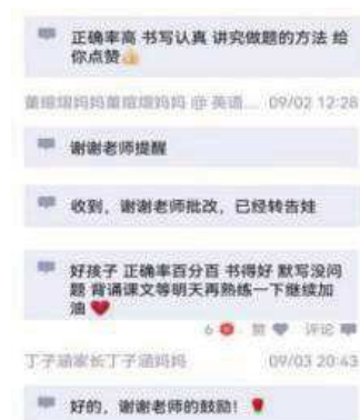
图 6 点对点的形式和学生交流

英语是语言实践课。课堂是才教学主阵地,教师应当把握好网络和教学之间的关系,QQ 老师助手是辅助教学的手段。师生在网络平台交流英语,缺少在课堂那样面对面交流的情景。然而,QQ 老师助手存在缺乏人与人之间交互性的缺憾,它最终不能代替真实的师生语言交流。再加上部分学生的学习动机不强,自觉性不够,自主学习能力偏弱,参与度不足,跟不上老师讲课的思维。