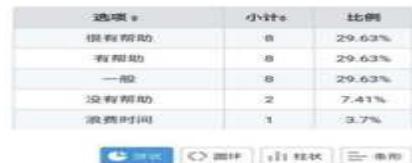
图 1 中职酒店专业学生情况调查

1. 问卷结果: 从表 1 数据可以看出, 40.74% 的定向企业在实际用人过程中发现, 目前中职酒店专业定向培养学生在学校所学专业技能与他在企业工作时的联系不大, 目前学校培养出的学生远离企业员工要求、岗位贴度低。