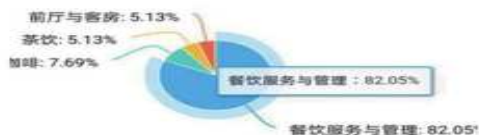
图2 中职酒店专业课程

1. 问卷结果：图2反映出酒店及相关产业不同方向职位空缺所占比率。酒店职位事实上的空缺与员工招聘难是整个酒店行业目前的棘手问题。在如今行业实际操作中，不同岗位所需人员性质、能力要求是不一样的。在与企业进行访谈调查的过程中还发现行业人员短缺存在流动性大、稳定性差的长期问题以及人才缺口与培养目标不吻合的紧迫性问题。