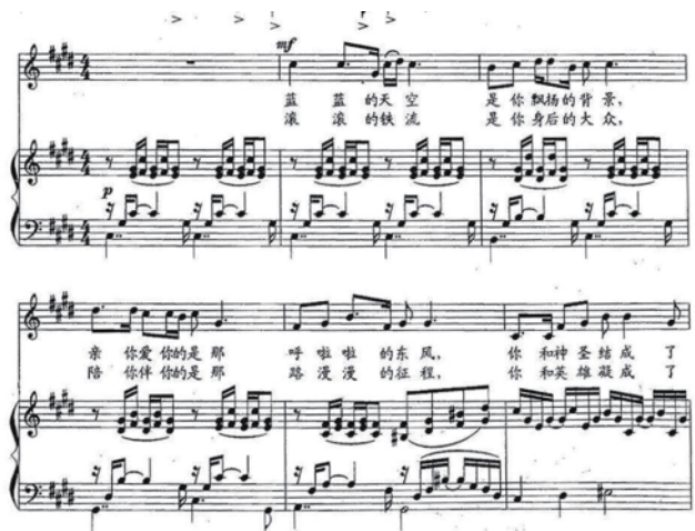
图2 选自歌曲《红旗颂》中的旋律片段

结构助词“的”在选择“di”音或者“de”音时,并不是由美声、民族或者通俗唱法去决定的,也不是由歌曲的作词作曲者决定的,而是根据作品的内涵及其情感表达的需要,根据作品及其发音的语言规律,需要声音和音乐旋律的走向形成高度融合,在此,由二度创作的演唱者自主把握,根据发音技巧发出科学的声音,将声音与字词声调相互配合,完美地进行字音处理,从而发出科学并且优美、动听的歌声。除外,我们在选择结构助词“的”的发音时,也可以根据音值的长短和旋律在歌唱中位置的高低,以及在前一个字的韵母发音区中,选择发哪个音会更加合适,哪个发音会使声音保持圆润、位置统一的美感。而在我们歌唱中,存在着语言的元音发音,一般我们的元音字母有a、e、i、o、u五个,根据字音的开口规律,一般来说,如果“的”字前面是开口音,口型最好发“di”,发声器官容易收住字音;但如果前面是闭口音,发“de”会更符合发音习惯。